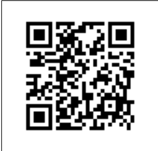
線上報名 QR Code

選課系統 key in A 班(多益班) (多益)_____分 B 班(多益班) (托福)_____分 C 班(托福班) (其他)_____分